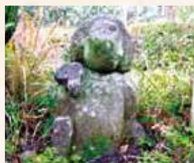
94 7号 (宮崎小路)