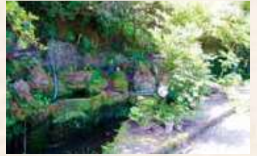
49 広田家庭園 (垂水市指定)