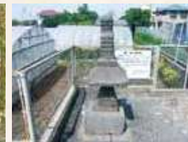
54 宝塔 (垂水市指定)