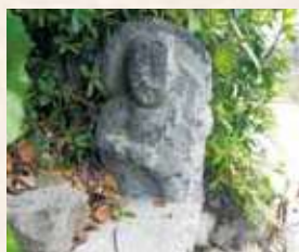
96 10号 (深港)