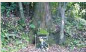
57 宇喜多秀家潜居跡 (垂水市指定)

宮脇(玉照寺跡)の石塔群と同系統のもので同じ室町期のものと推定されます。この石塔の中に板碑が1基ありますが、垂水市内で初めて発見された、歴史研究上貴重なものです。