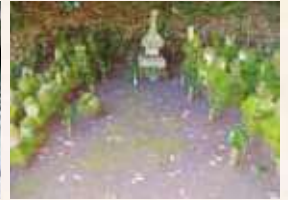
51 島津氏久逆修塔と石塔群 (垂水市指定)

鎌倉初期から室町期。山伏の修行道場がありましたので道場観音とも。財宝伝説があります。