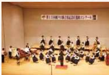
「瀬戸口藤吉翁記念行進曲コンクール」