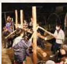
109 壁うっくじい (柘原)

垂水には多くの郷土芸能が伝承されていますが、その多くが兵士の士気を高めたり、五穀豊穡を祈願するものです。伝統行事には藩政時代から続く馬追いの行事“おろごめ”や、子孫繁栄を願う“壁うっくじい”など、ユニークなものがあります。昨今は少子、高齢化などが原因で、伝承が年々難しくなっています。