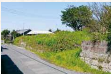
31 新城島津家お仮屋跡