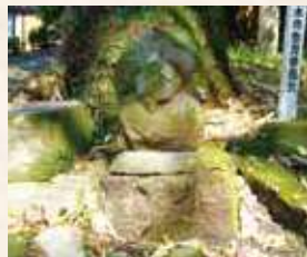
89 1号 (新城)

※廃仏毀釈：明治初年、政府の神道国教化政策、仏教排斥運動。仏堂・仏像・経文などが破壊された。