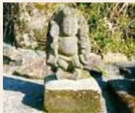
91 4号 (田上)