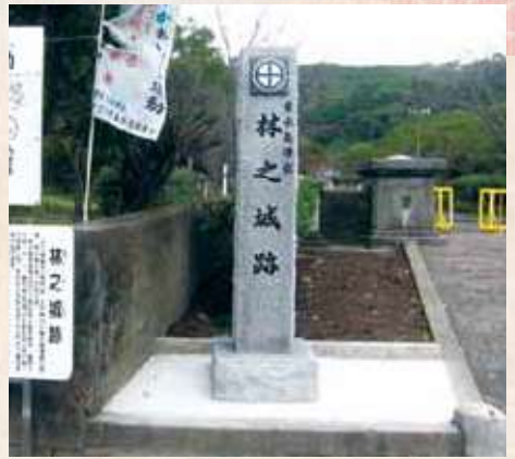
23 林之城築城記念碑

垂水城（荒崎城）が手狭になったので、垂水島津家4代領主久信は、慶長16年（西暦1611）林之城を築城し、家臣団とともに移ってきました。当時は山林原野だったため「林之城」と言われていましたが幕府の一国一城令により後に、「館」「お仮屋」と呼ばれるようになりました。