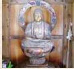
34 中浜地藏 (垂水市指定)

鹿児島県下最古級の木仏像。永正3年(西暦1506)高城城主肥後文次郎盛明が太守島津忠昌を施主とし、子孫繁栄、武運長久、領内安穏を祈願し、建立。毘沙門天、多聞天を従え、邪鬼を踏みつぶしています。 仏師は加治木 かいは の快扶 かいは とされています。