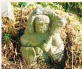
95 8号 (松ヶ崎)