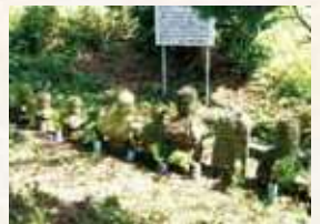
56 諏訪石塔群 (垂水市指定)

玉照寺は江戸時代、心翁寺四世竜谷和尚により開山。石塔群は室町期のものとされ、当時新城は肥後氏の支配下にあり、その後伊地知氏へと移りました。