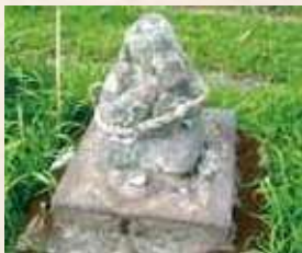
92 5号 (市木)