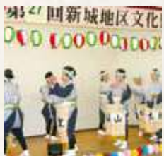
107 浦川内の甚句節 (新城)