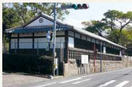
20 お長屋（垂水市指定史跡）

400年以上の歴史を持ち、貴重な木造建築物です。下級武士の詰め所とされています。