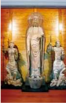
33 勝軍地藏 (鹿児島県指定)

鹿児島県下最古級の木仏像。永正3年(西暦1506)高城城主肥後文次郎盛明が太守島津忠昌を施主とし、子孫繁栄、武運長久、領内安穏を祈願し、建立。毘沙門天、多聞天を従え、邪鬼を踏みつぶしています。 仏師は加治木 かいは の快扶 かいは とされています。