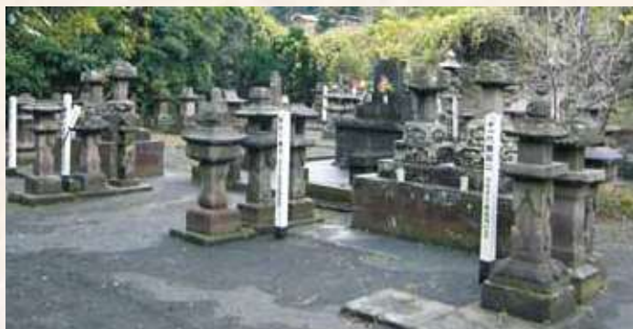
14 垂水島津家墓地（垂水市指定史跡）