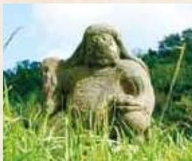
93 6号 (中俣)