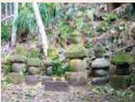
52 浦内石塔群 (垂水市指定)