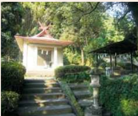
24 初代忠将を祀る「御殿加神社」 おでんか