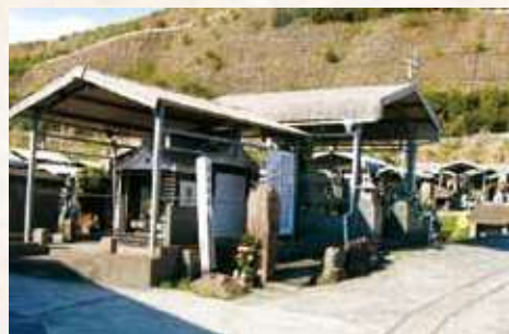
17 島津家菩提寺「成就院」跡