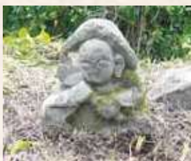
97 12号 (中浜)