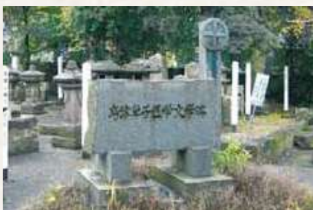
19 島津草子医学文学碑