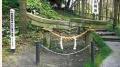
48 牛根麓稲荷神社の埋没鳥居 (垂水市指定)

高峠つつじヶ丘公園は、大隅半島のほぼ中央に位置し、峠の標高722メートルにあり、100種類、10万本以上のつつじが春になると色鮮やかに咲き誇ります。