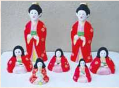
垂水島津家の「八百姫人形」

文禄・慶長の役（西暦 1592～1598）の時に、島津義弘が伴い帰った陶工たちが土人形を製作したのが、垂水人形のおこりと言われています。垂水島津家でも職人を招き、娘、花嫁、福神、犬、猫、鯛などの人形が作られました。やがて垂水人形は冬場農家の副業になり、大正の初め頃は 20 軒の製作者があり、1 年に 800 個も作られたそうです。大隅半島から志布志方面まで販路も拡大し、隆盛を極めていました。しかし、昭和 10 年（西暦 1935）頃からすたれ、戦後一時途絶えました。垂水人形は素焼きの土人形で、こねた粘土を型わくに入れて型を作り、乾燥させたものを素焼きにして、胡粉を塗り、その上に色づけした素朴なものです。大きさは 12～60 cm、3、5 月の節句に飾られ、昔から厄時災難を除き、出世開運、子どもの健やかな成長、幸運を祈願する意味を持っていました。戦後から途絶えていましたが、帖佐人形や残っている垂水人形の原型を参考に平成元年（西暦 1989）に復活しました。なお、垂水人形は鹿児島県の伝統的工芸品に指定されています。