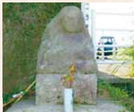
90 2号 (原田)