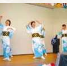
106 御所の御庭踊り (新城)