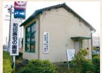
112 「和田英作使用の画室」