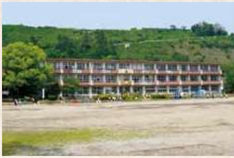
22 居城林之城跡（現垂水小学校）

垂水城（荒崎城）が手狭になったので、垂水島津家4代領主久信は、慶長16年（西暦1611）林之城を築城し、家臣団とともに移ってきました。当時は山林原野だったため「林之城」と言われていましたが幕府の一国一城令により後に、「館」「お仮屋」と呼ばれるようになりました。