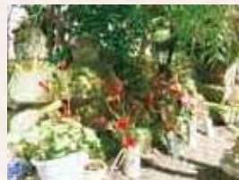
53 段の五輪塔 (垂水市指定)