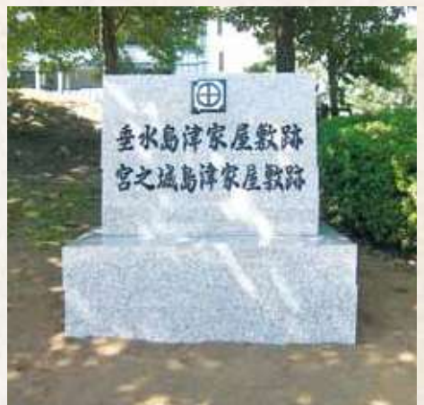
32 鹿児島県民交流センターに建つ垂水市島津家屋敷跡の碑