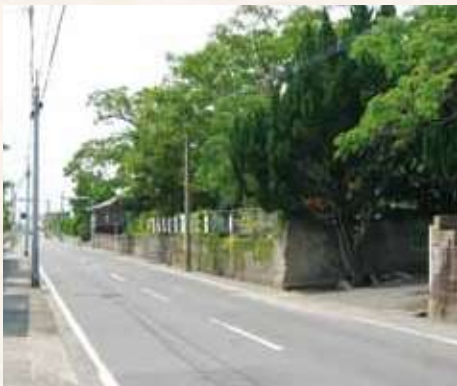
27 昔をしのばせる麓町