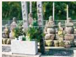
55 宮脇(玉照寺跡)の石塔群 (垂水市指定)