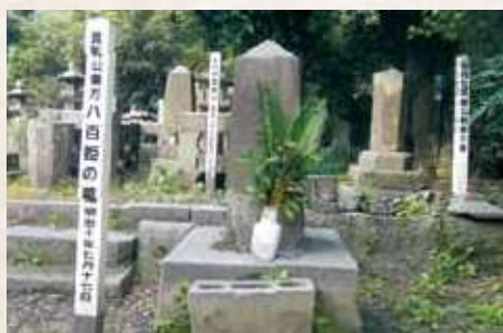
18 徳川13代家定正室候補「八百姫」の墓