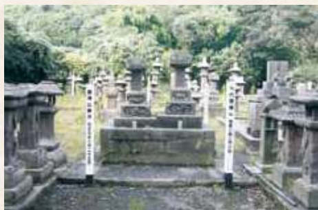
15 宝篋印塔「9代貴儔公」の墓