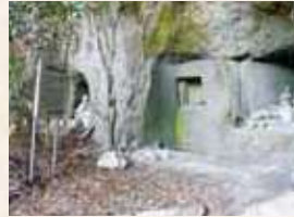
50 岩屋観音堂跡と石塔群 (垂水市指定)

鎌倉初期から室町期。山伏の修行道場がありましたので道場観音とも。財宝伝説があります。