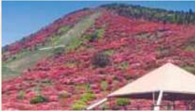
47 高峠のツツジ (垂水市指定)

高峠つつじヶ丘公園は、大隅半島のほぼ中央に位置し、峠の標高722メートルにあり、100種類、10万本以上のつつじが春になると色鮮やかに咲き誇ります。