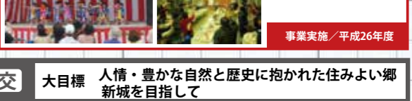
事業実施 / 平成26年度

三和交流促進事業による、水之上の良さを自らが調べた文化財・観光マップ作成や、おんだんこらの看板で、来場者数を維持している。