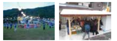
事業実施 / 平成27年度