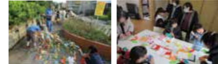
事業実施 / 平成29年度