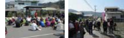
事業実施 / 平成27年度