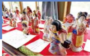
春の垂水土人形展 (H29.2.26)