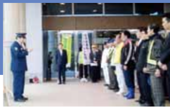
春の全国交通安全運動出発式 (H29.4.6)