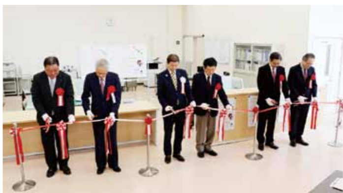
地域包括センター オープンセレモニー (H29.4)

答 中洲橋に水道管が付いているが、今回の台風災害により、曲がっているものの、完全に折れておらず老朽もしていないことから、今回の補助対象外となった。