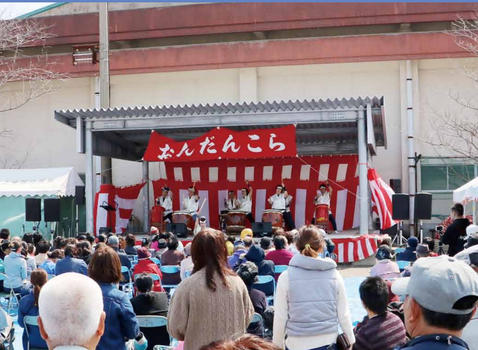
おんだんこら祭り (H29. 4. 2)