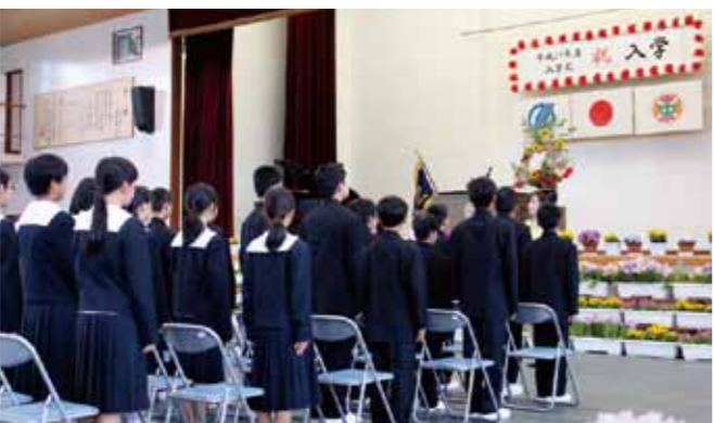
垂水中央中学校入学式 (H29.4)

答 鹿児島県と43市町村で連絡会をつくり、保険者統一の協議を進めている。ただし、新しい制度ができるにあたっての財政運営というのは非常に厳しい。