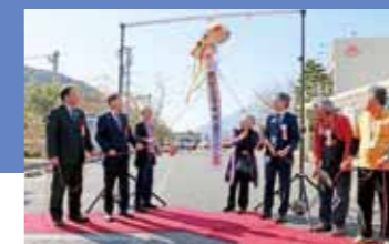
道の駅来場 900 万人到達記念式典 (H29.2.19)