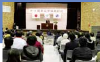
第17回若草文学賞表彰式 (H29.2.18)