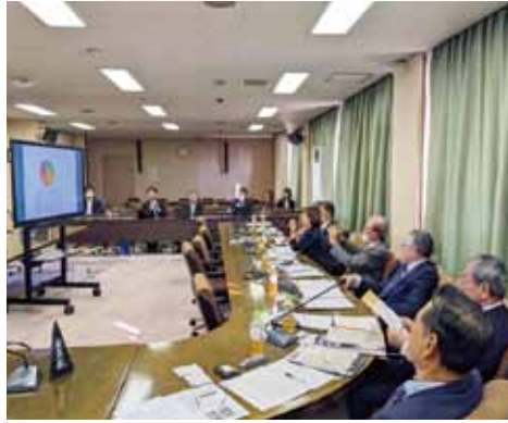
橿原市役所での研修状況