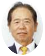
川畑 三郎 議員