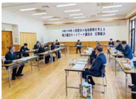
1/11 小規模市議長会定期総会 （森の駅たるみず）