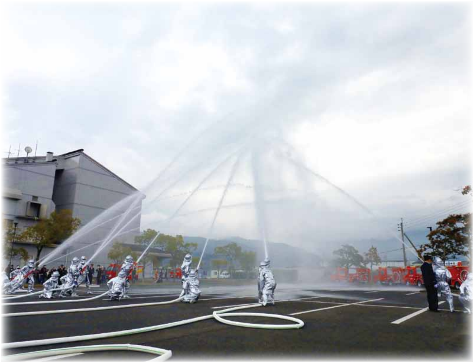
消防出初め式 (R6.1.6 垂水市文化会館駐車場)