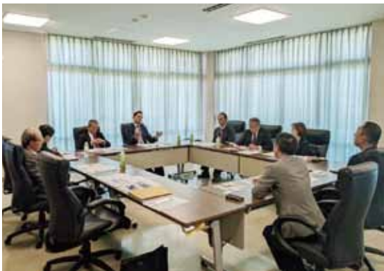
三宅町役場での研修状況