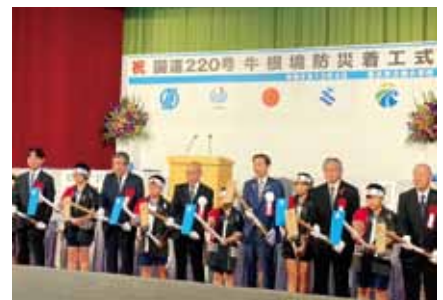
12/3 国道220号牛根境防災着工式