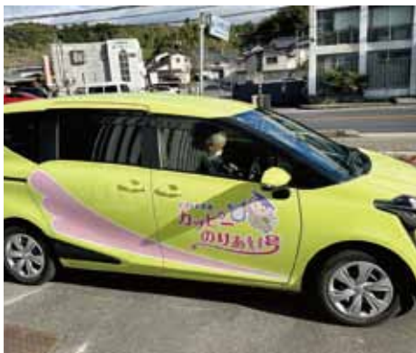
カッピのりあい号