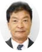
持留 良一 議員