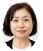
池田 みすず 議員