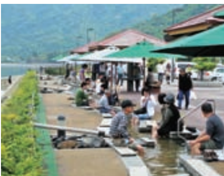
たるみず春フェスタ 2011