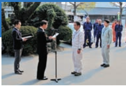
災害復興支援派遣