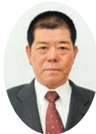
議会運営委員会 産業厚生委員会