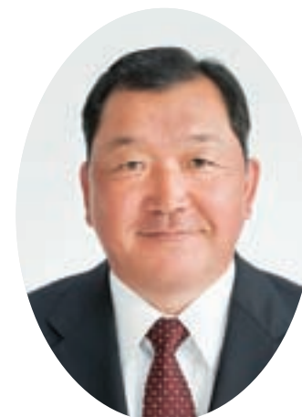
議会運営委員会 総務文教委員会