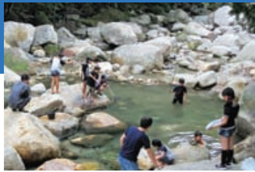
ニジマス釣り【森の駅】