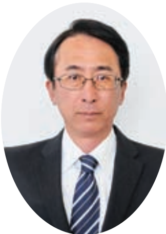
産業厚生委員会 市議会だより編集委員