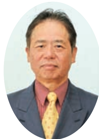
総務文教委員会 議会運営委員会