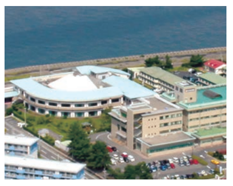
◎コスモス苑（左）と垂水中央病院

manifesto2016 - PEACE OF MIND 1 / 安心への挑戦に関する主な事業を紹介！（パート1）