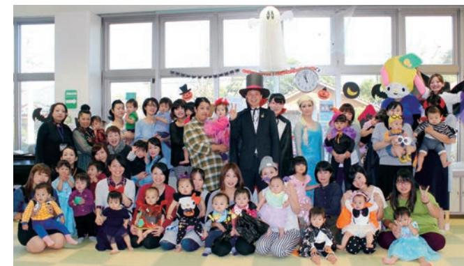
↑未来のために子どもたちのために、挑戦します！／子育て支援センター（H27.10.26撮影）