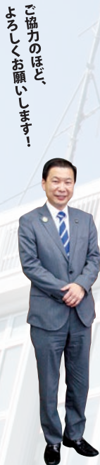
ご協力のほど、 よろしく申し上げます！

度の重点施策は27年度に引き続き「元気な垂水づくり！経済・安心・未来への挑戦！」と設定いたしました。この3つの挑戦には、それぞれ3本の柱があります。これに基づき、各事業を進めてまいります（詳細は次のページ以降に掲載しています。どうぞご覧ください）。