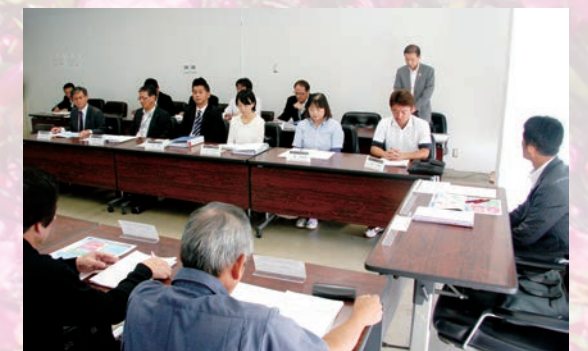
↑第5回垂水市まち・ひと・しごと創生総合戦略審議会 / H28.10.23開催

では一体、具体的に何をするのでしょいか。「総合戦略」には、4つの基本目標があります。基本目標を達成するために、数値目標や具体的な施策を設定しています。例えば、「南の拠点整備事業（詳細8ページ）」は、基本目標4に盛り込まれたもの