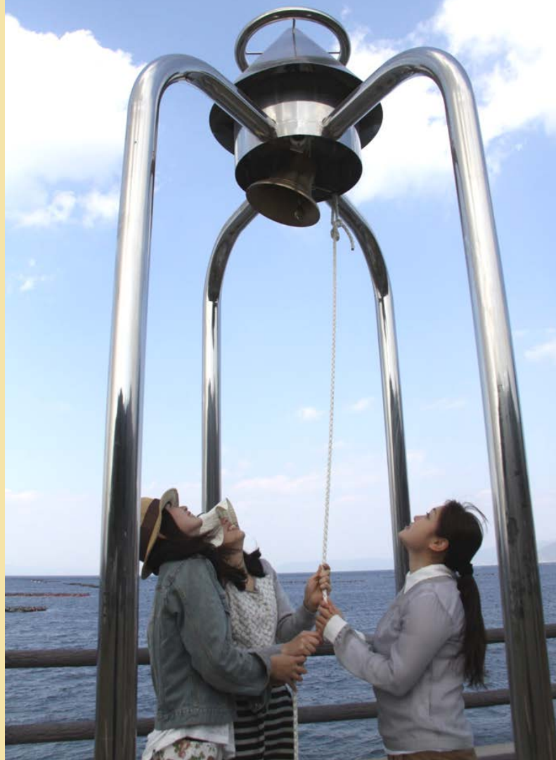
幸運の釣鐘（道の駅）