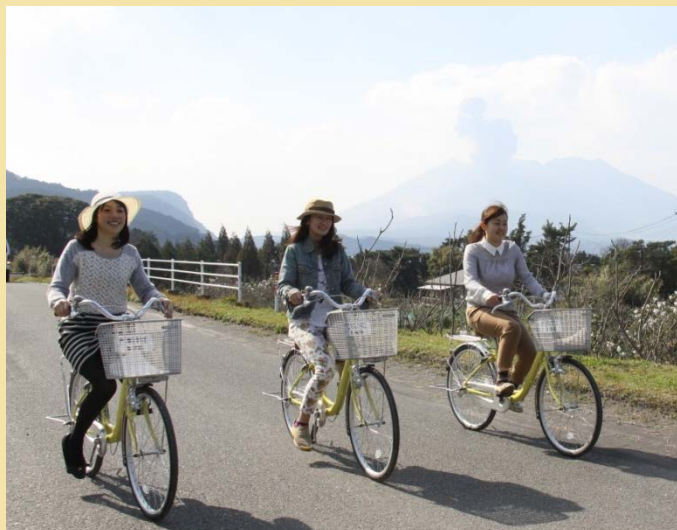
レンタサイクル導入（道の駅）