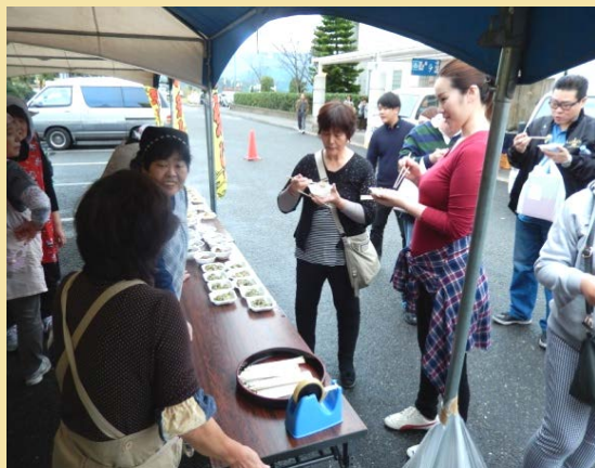
郷土料理ふるまい