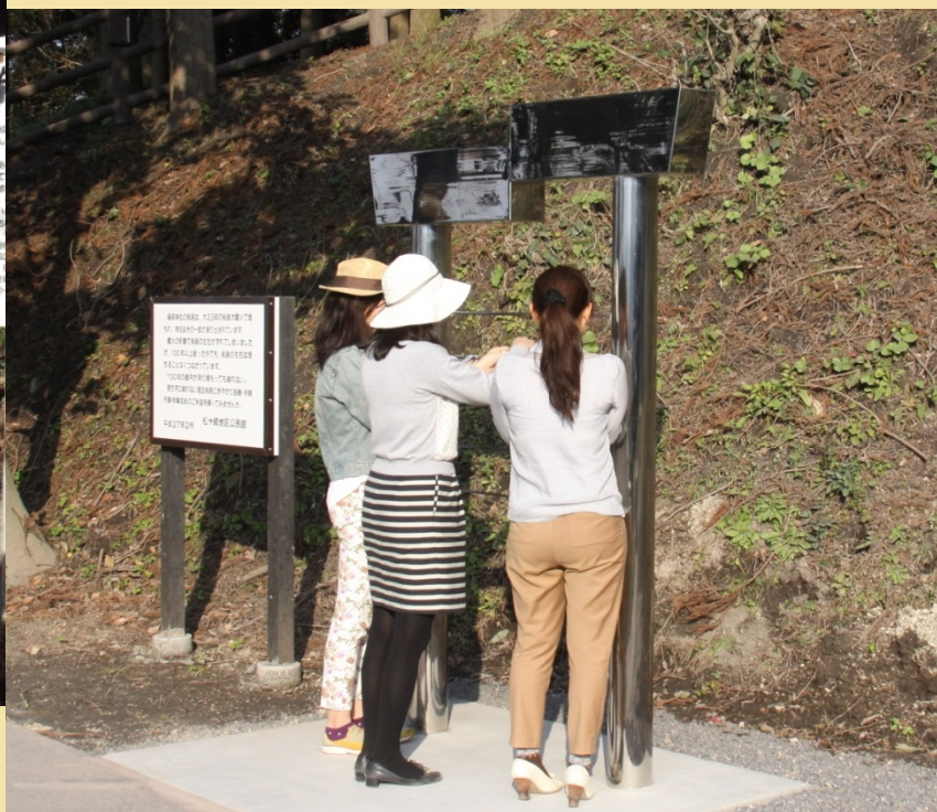
おみくじ・おみくじ掛け（埋没鳥居）