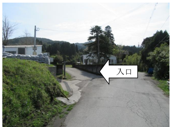
※2 大野地区公民館 別館 (駐車場入口)