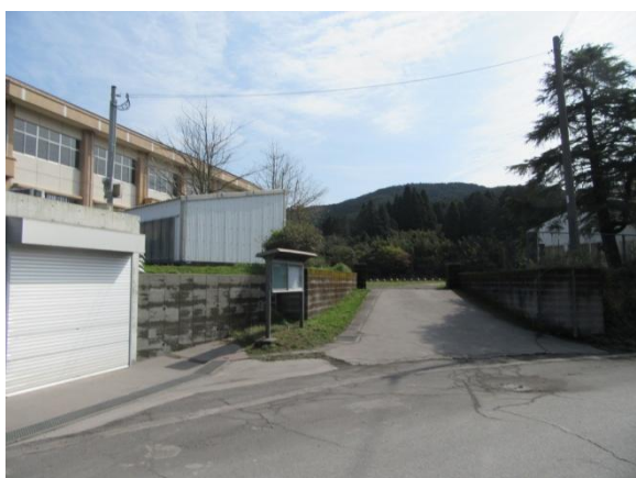
※ 1 大野地区公民館 別館 (駐車場入口)