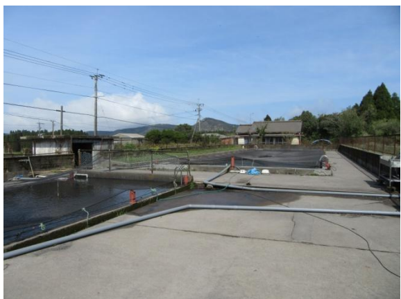
※ 1 大野地区公民館 別館 ニジマス養殖場 (行政視察会場②)