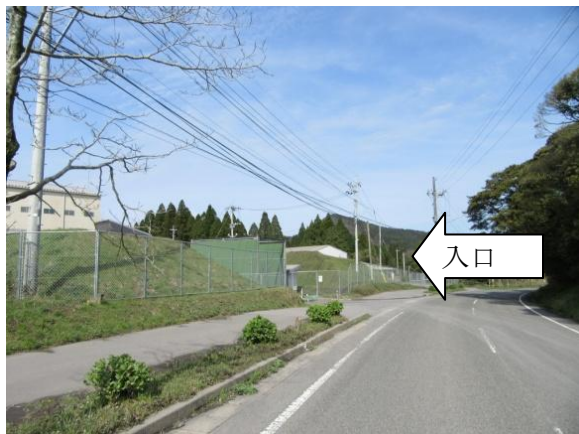
※2 バイオマス発電所（駐車場入口） （行政視察会場①）