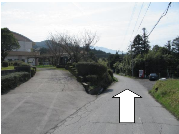
※2 大野地区公民館 別館付近