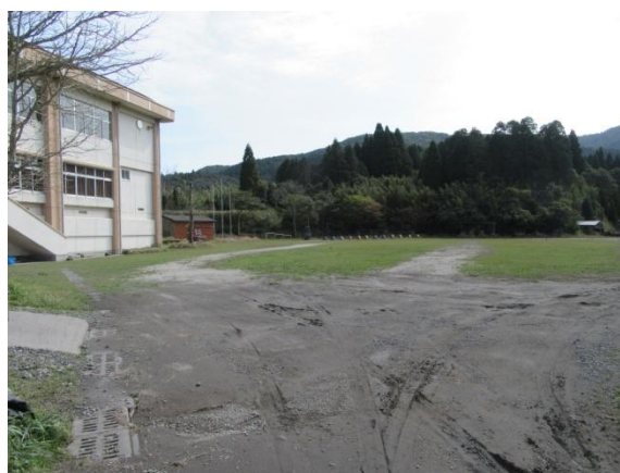
※ 1 大野地区公民館 別館 運動場 (駐車場)