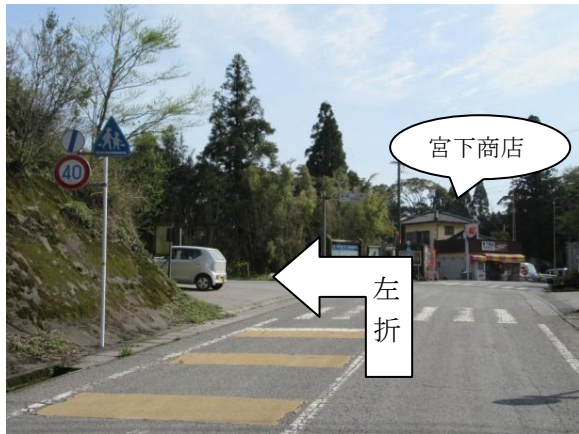
※1 バイオマス発電所入口①