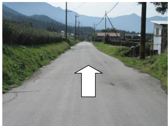
※1 大野地区公民館 別館へ進行