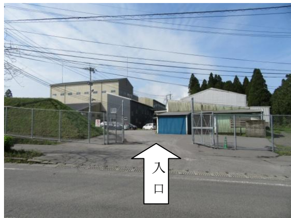
※2 バイオマス発電所（駐車場入口）