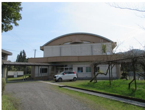
※ 1 大野体育館 (錦江湾奥会議会場)