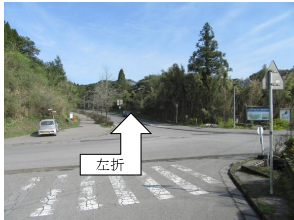
※1 バイオマス発電所入口②