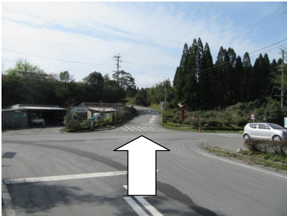
※ 1 県道 71 号線 出口付近