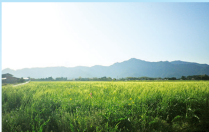
鹿屋市東原町から望む高隈連山