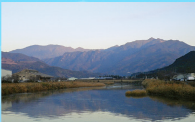
垂水市から望む高隈連山