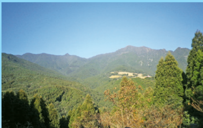
鳴之尾林道から望む高隈連山