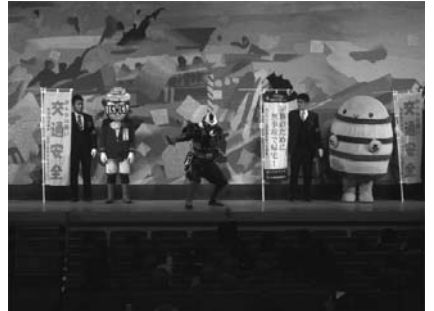
県警音楽隊コンサート