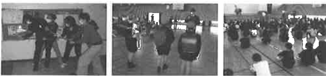
(4月20日に実施しました。)