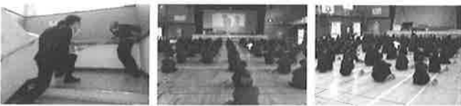
(4月22日に実施しました。)