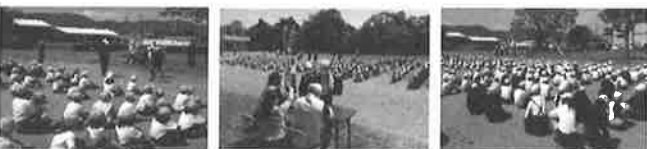
(4月27日に実施しました。)