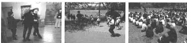
(4月19日に実施しました。)