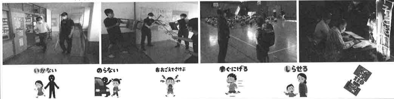
(110番の家への駆け込み訓練)