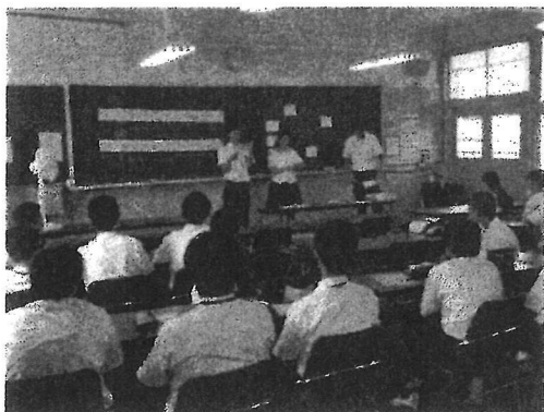
【英語～聞き取れるかな?英語クイズ】