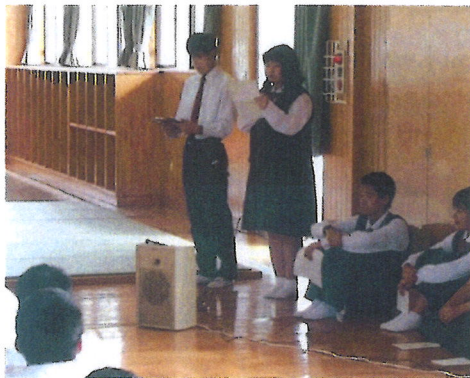
【進行を務める生徒会役員】