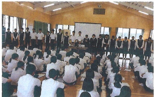
【先輩からのメッセージ発表】