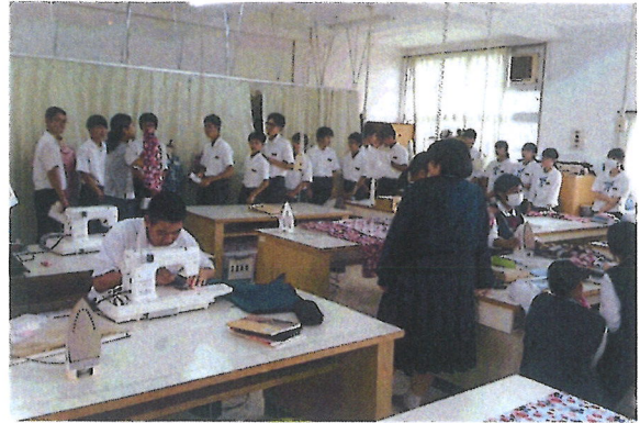
【生活デザイン科の被服実習を見学】